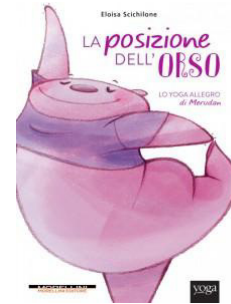
La Posizione Dell'Orso

I campi delle competenze riguardano anatomia e fisiologia, psicologia, pedagogia, comunicazione , metodologia della ricerca (da intendersi come capacità di studiare e approfondire, di avere rigore metodologico), storia e filosofia dello yoga, con la conoscenza dettagliata di almeno alcuni dei testi storici che stanno alla base della tradizione yoga ortodossa e eterodossa, e antropologia dello Yoga, nonché gli aspetti legislativi legati alla