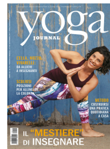
Yoga Journal Settembre 2017